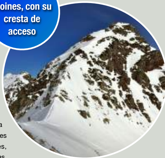
Pico des Moines, con su cresta de acceso

Desde los diferentes picos se puede disfrutar de fantásticas vistas, así como bajadas por diferentes palas con diferentes orientaciones, que permiten buscar diferentes tipos de nieve.