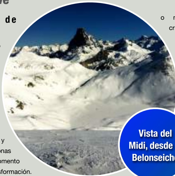
Vista del Midi, desde el Belonseiche

El circo del ibón de Escalar permite hacer varias cimas, disfrutando de una zona de montaña muy próxima a la estación, con una salida muy rápida esquiando, por lo que es frecuentada habitualmente por esquiadores, aunque también por excursionistas con raquetas,